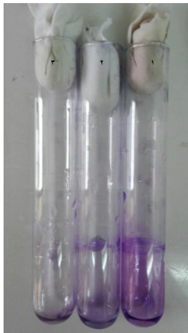
تصویر ۲- تشکیل بیوفیلم به روش کدورت لوله

نتایج حاصل از جدایه‌های کلبسیلا تشکیل دهنده بیوفیلم در روش کدورت لوله بر اساس ضخامت رنگ کریستال و یوله بر جدار لوله و کف لوله مورد بررسی قرار گرفت. جدایه‌هایی که دارای لایه‌ی ضخیم و قابل روئیت رنگ در کف و جدار لوله بودند؛ جدایه‌هایی که دارای لایه‌ی نازک‌تر از رنگ در کف و جدار لوله بودند و جدایه‌هایی که فاقد هر گونه لایه‌ی